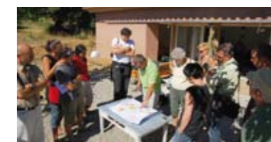
Visite d'une maison en terre crue le 21 septembre 2010 - Saint-Laurent-du-Verdon

Réchauffement climatique, augmentation de la facture énergétique, l'habitat est plus que jamais au cœur des interrogations de chacun. Avec l'arrivée de la nouvelle réglementation thermique des bâtiments, de nouvelles approches sont nécessaires pour aller vers un habitat plus écologique. C'est pourquoi, le Parc du Verdon et le Syndicat Mixte des Pays du Verdon, engagés sur la maîtrise de l'énergie, proposent de visiter des maisons, installations s'inscrivant dans cette démarche. Elles permettent de découvrir concrètement comment construire et/ou équiper de manière durable et confortable sa maison, tant sur le plan des matériaux, techniques mises en œuvre, que des énergies renouvelables.