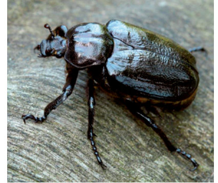
1. Pique-prune

Plus impressionnant, vous apercevrez peut-être un circaète Jean-le-blanc ou un vautour moine, oiseaux nichant en forêt, survoler le massif où vous vous trouvez. Baissez maintenant les yeux, l'aphyllante de Montpellier et ses fleurs bleues lancées à l'assaut du ciel comme des étoiles, tapisse certaines forêts de chênes. Si vous êtes chanceux et, au pied d'une falaise, vous observerez peut-être une Doradille du Verdon (photo 2). Fleurs, insectes, mammifères, champignons... la forêt est l'hôtesse bienveillante de toutes ces familles. Non, la forêt du sud n'est pas vouée qu'aux incendies.