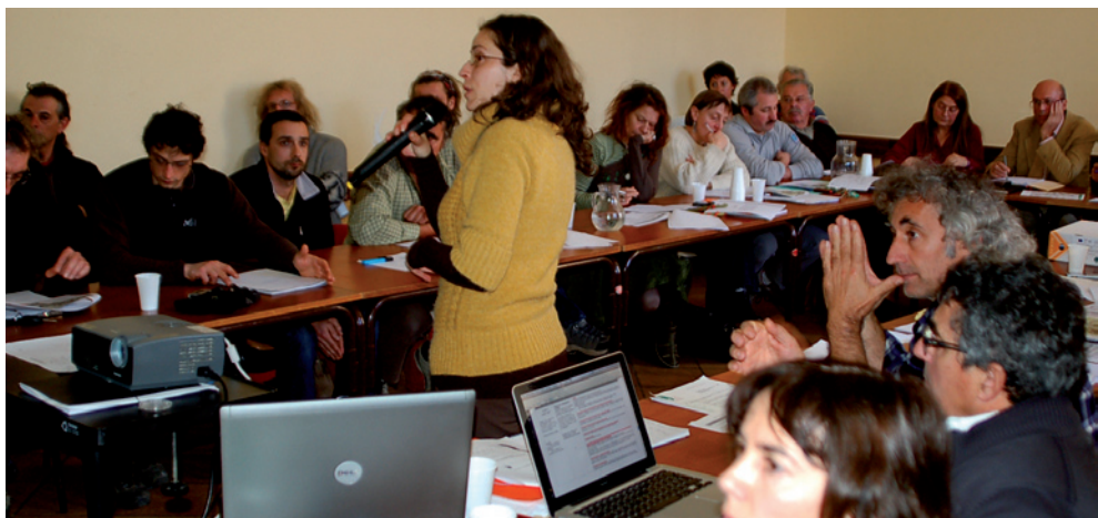
Deuxième réunion de concertation à La Palud-sur-Verdon

Les élus du Parc naturel régional du Verdon ont défini un plan de gestion visant à concilier les usages et la préservation des milieux aquatiques des gorges du Verdon. Ce plan est l'aboutissement d'un travail d'études mené sur plusieurs années et d'une démarche de concertation exemplaire lancée en août 2010. Cette concertation a, en effet, réuni en un même débat les services de l'État et des collectivités locales, les associations de défense de l'environnement, les associations de pratiquants d'activités liées à la rivière (pêche, eau vive, spéléo, canyoning), les professionnels de ces activités ainsi que les entreprises actives dans la rivière comme EDF.