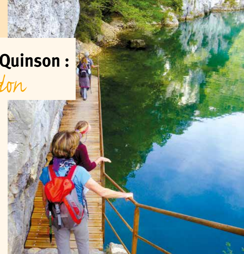
Photo des explorateurs du Verdon sur le sentier

En raison de son caractère exemplaire, le Parc a accompagné ce projet dès sa conception et l'a soutenu en mobilisant ses partenaires signataires