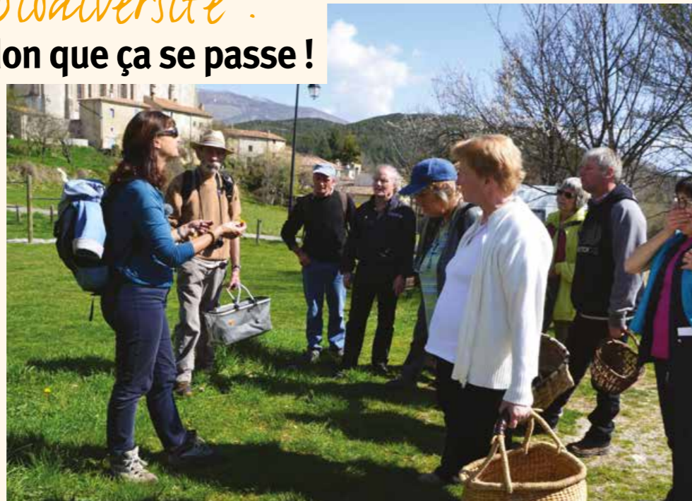
Inventaire et cueillette de salades sauvages

Le Parc du Verdon propose donc à tous, petits et grands, un programme dense et varié d'animations : sorties thématiques, comptages, initiations, séances d'observation ou de captures avec des naturalistes passionnés qui partagent et transmettent leurs connaissances. Les inventaires de la biodiversité sont avant tout une belle aventure humaine, des rencontres et des échanges, qui se déroulent dans une ambiance conviviale et chaleureuse au sein du village : expositions, courts métrages, conférences, balades, ateliers photos, sorties littéraires, etc.