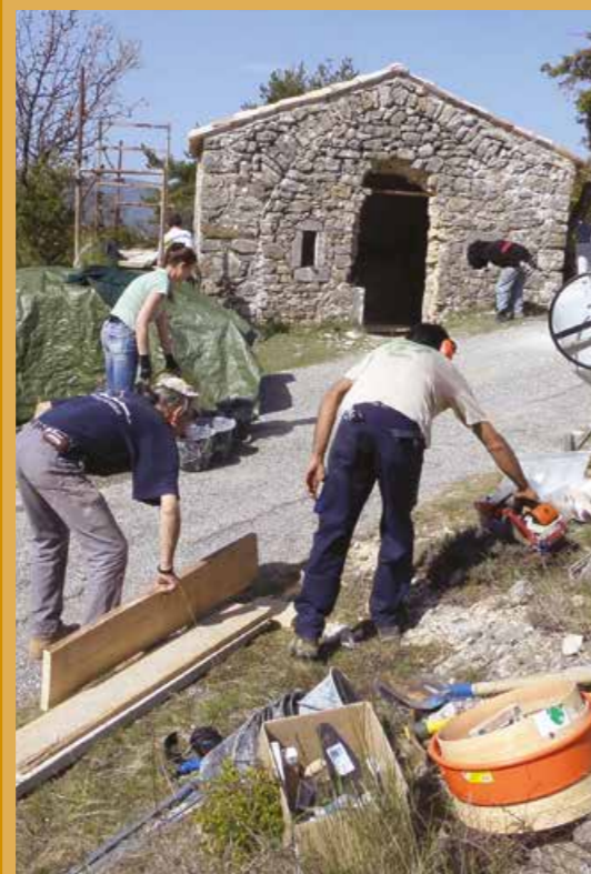
Chantier de restauration de la chapelle Saint-Antoine à Bargème

Guidée par cette philosophie, l'association « les chemins du patrimoine » de Saint-Julien-le-Montagnier s'est lancée en 2011 dans le projet de restauration d'un four à pain. Accompagnée par le Parc, soutenue par la commune et guidée par un formateur de l'École d'Avignon venu partager ses compétences avec les bénévoles, l'association a gagné son pari : le four est sorti de l'oubli et le hameau a retrouvé son âme. On pourrait presque humer une bonne odeur de pain ! Ce chantier-école a été présenté au 25 e concours pour la sauvegarde du patrimoine, organisé par la SPPEF (Société pour la protection des paysages et de l'esthétique de la France) qui lui a attribué un diplôme. Quel meilleur remerciement pouvait en attendre toutes les personnes qui se sont impliquées !