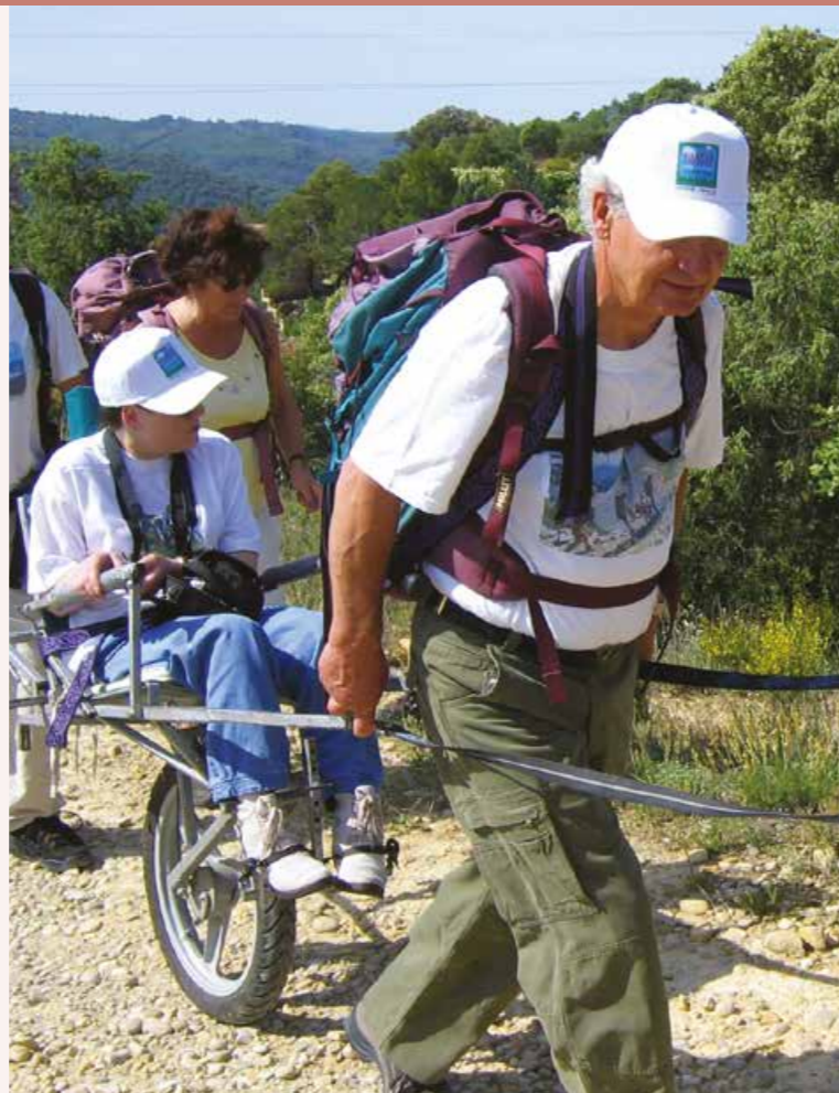
La « Joëlette », fauteuil à une seule roue, permet d'emmener une personne à mobilité réduite sur la plupart des sentiers.