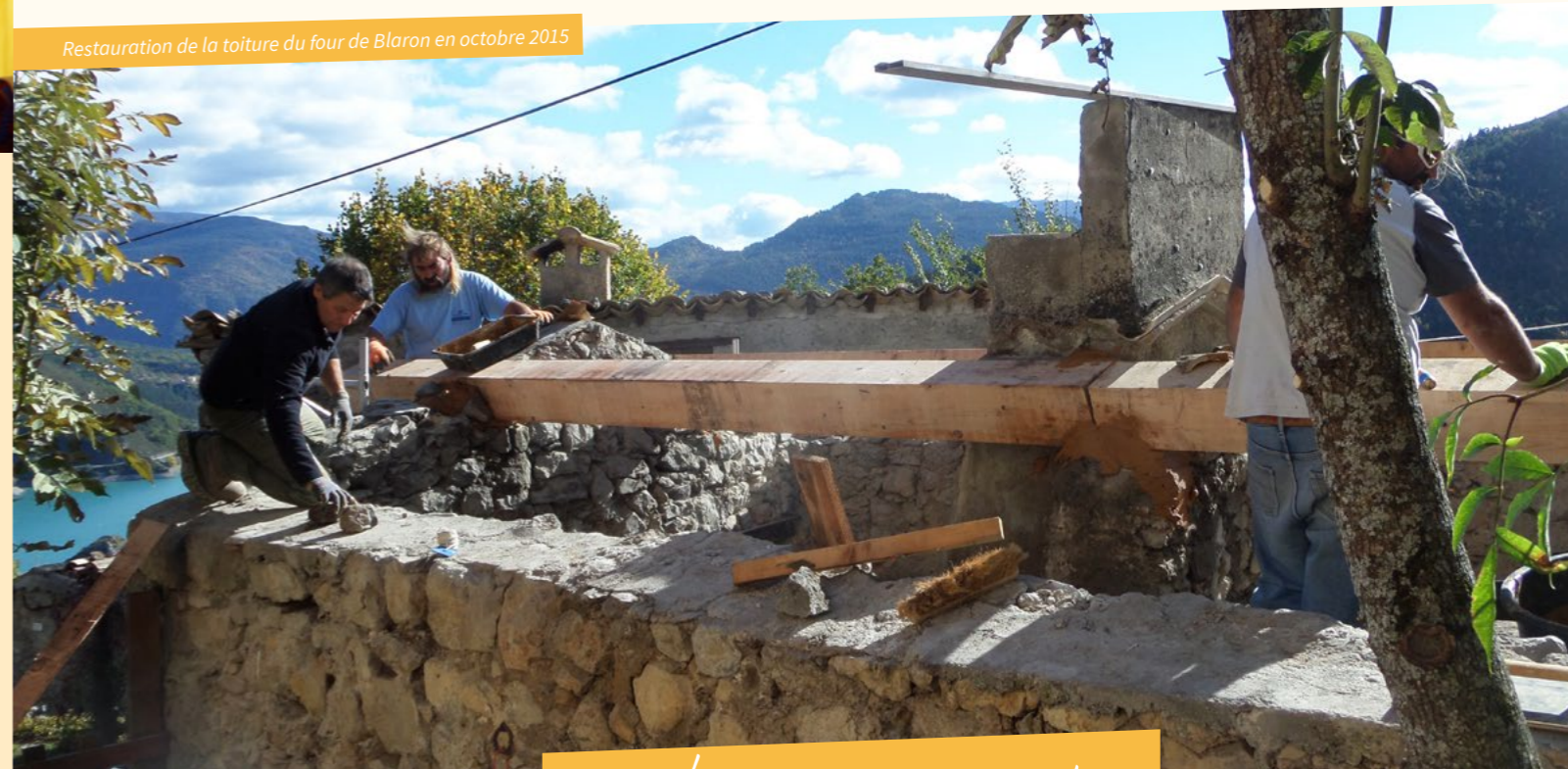
Restauration de la toiture du four de Blaron en octobre 2015

Information et inscription sur www.parcduverdon.fr/agenda