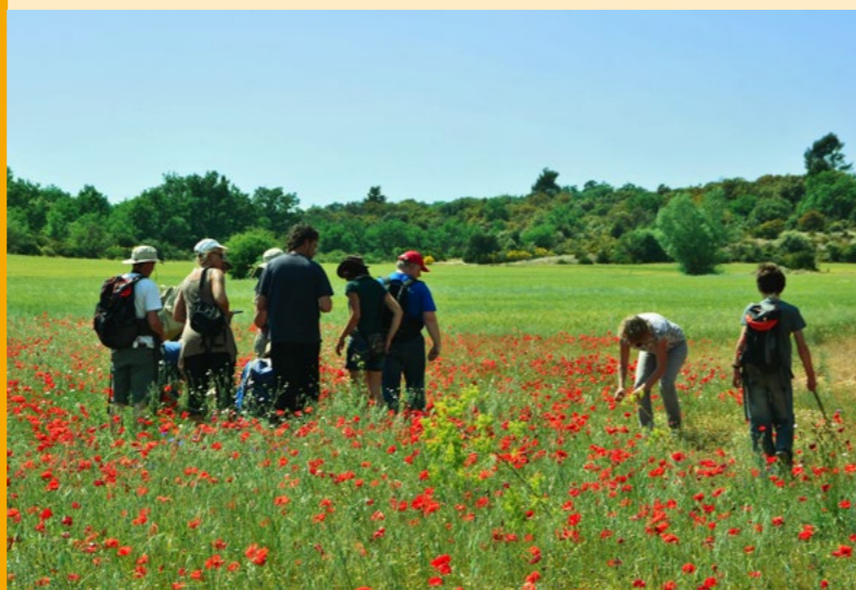
Inventaires des plantes messicoles à Saint-Julien-le-Montagnier

Retrouvez le programme complet sur le site internet du Parc et inscrivez-vous directement sur www.parcduverdon.fr/agenda