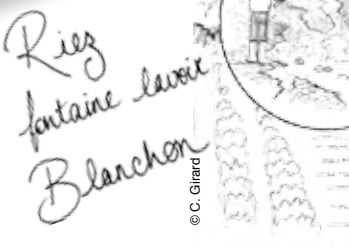
Ries fontaine lavoir Blanchon