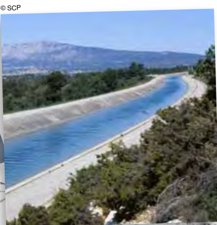
canal de Provence