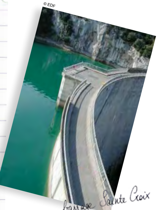
barrage Sainte Croix

Chaque seconde, le Verdon apporte plusieurs dizaines de milliers de litres d'eau dans la Durance. Mais auparavant, cette rivière s'alimente de l'eau qui tombe sur les 69 communes du bassin versant, et où 30 000 habitants vivent quotidiennement. Réservée pendant des siècles à l'irrigation des cultures et à la satisfaction des besoins en eau potable, l'eau du Verdon est aujourd'hui bien plus largement utilisée. À partir de 1949, à raison d'un barrage tous les 5 ans, les lacs de Castillon, Chaudanne, Esparron, Quinson et enfin Sainte-Croix ont été créés. Les usines associées produisent chaque année 600 millions de kWh, soit plus du quart de l'électricité consommée en région Provence-Alpes-Côte d'Azur. La Société du canal de Provence (SCP), afin d'alimenter la basse région provençale, capte environ 250 millions de mètres cubes par an dans le lac d'Esparron. Enfin, plus d'un million de touristes viennent chaque année naviguer sur les lacs ou découvrir les gorges sculptées par la rivière. L'eau turquoise du Verdon fournit donc aux hommes de multiples services. N'oublions pas qu'elle est aussi le lieu de vie de nombreuses espèces naturelles, qui sont la garantie même de sa qualité.