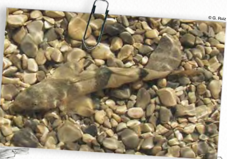
apron du Rhône