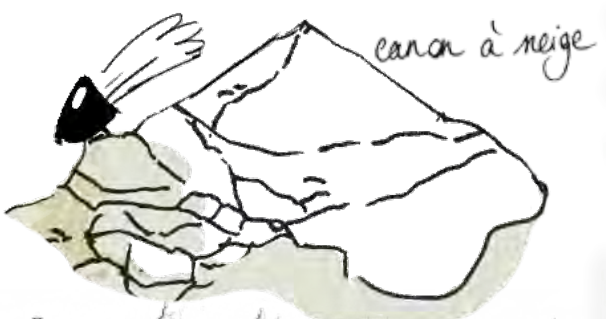
canon à neige

Façonné par les hommes, le Verdon est pour eux une rivière utile, de sa source à son embouchure :