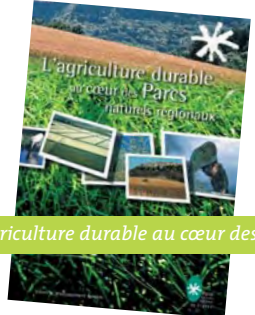
L'agriculture durable au cœur des Parcs (avril 2005)