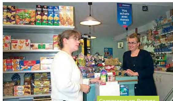
Commerce en Brenne