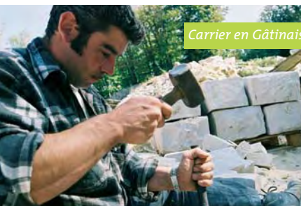
Carrier en Gâtinais français