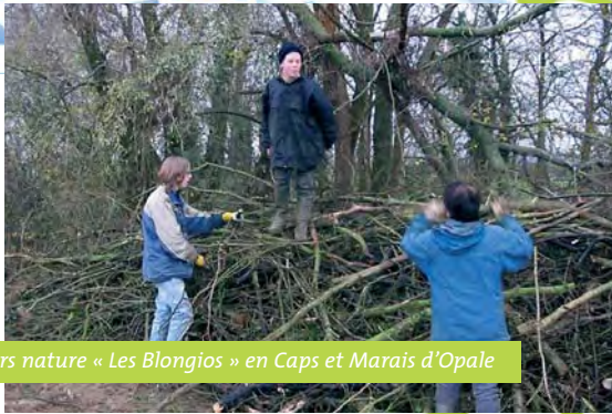
Chantiers nature « Les Blongios » en Caps et Marais d'Opale