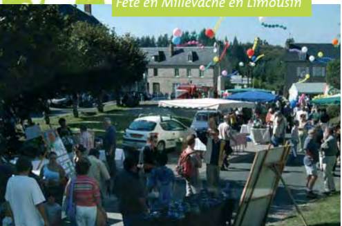
Fête en Millevache en Limousin

Ces enjeux sont souvent attachés à un contexte de faible densité et de vieillissement de population, mais peuvent également être liés à l’arrivée de nouvelles populations, favorisée par l’attractivité croissante d’une partie du milieu rural. Cela pose la question de la structuration du tissu social, du maintien d’une diversité de populations et du renforcement du lien social.