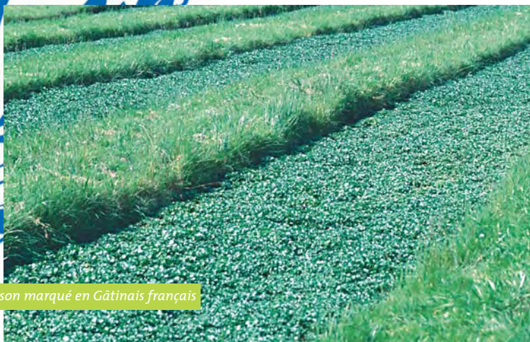
Culture du cresson marqué en Gâtinais français