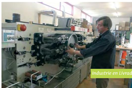
Industrie en Livradois-Forez

Mise en place d'opération de restructuration de l'artisanat et du commerce (conseil, aide à l'investissement).