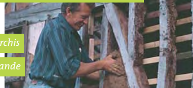
Savoir faire du torchis