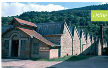
Usine en Pilat