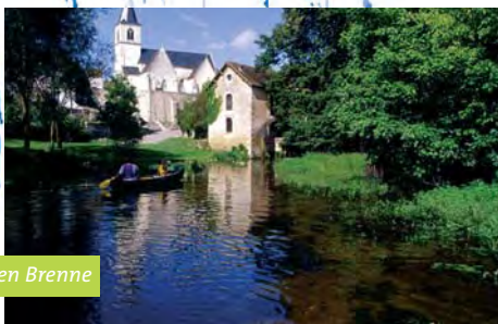
Tourisme en Brenne

Pour plus d'information sur des exemples d'actions conduites sur des Parcs, vous pouvez aller sur le site internet de la Fédération : www.parc-naturels-regionaux.fr/fr/approfondir/poles.asp