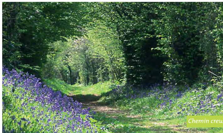
Chemin creux en Perche