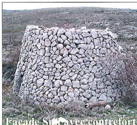
Facade Sud avec contrefort

Revenir à la cabane précédente pour reprendre le chemin qui passe devant la station de pompage. Environ une centaine de mètres plus loin, remarquer un sentier qui monte sur la droite et qui se dirige vers une splendide construction.