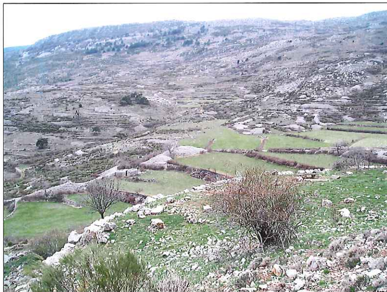
Vue sur le quartier de Clarréou avec, au premier plan, l'aire de battage.

Accolée à la bergerie, côté Est, une aire de battage caladée a été aménagée, avec un magnifique mur de soutènement..